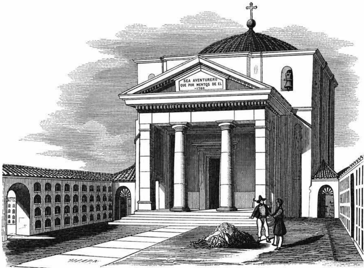
El Campo Santo.